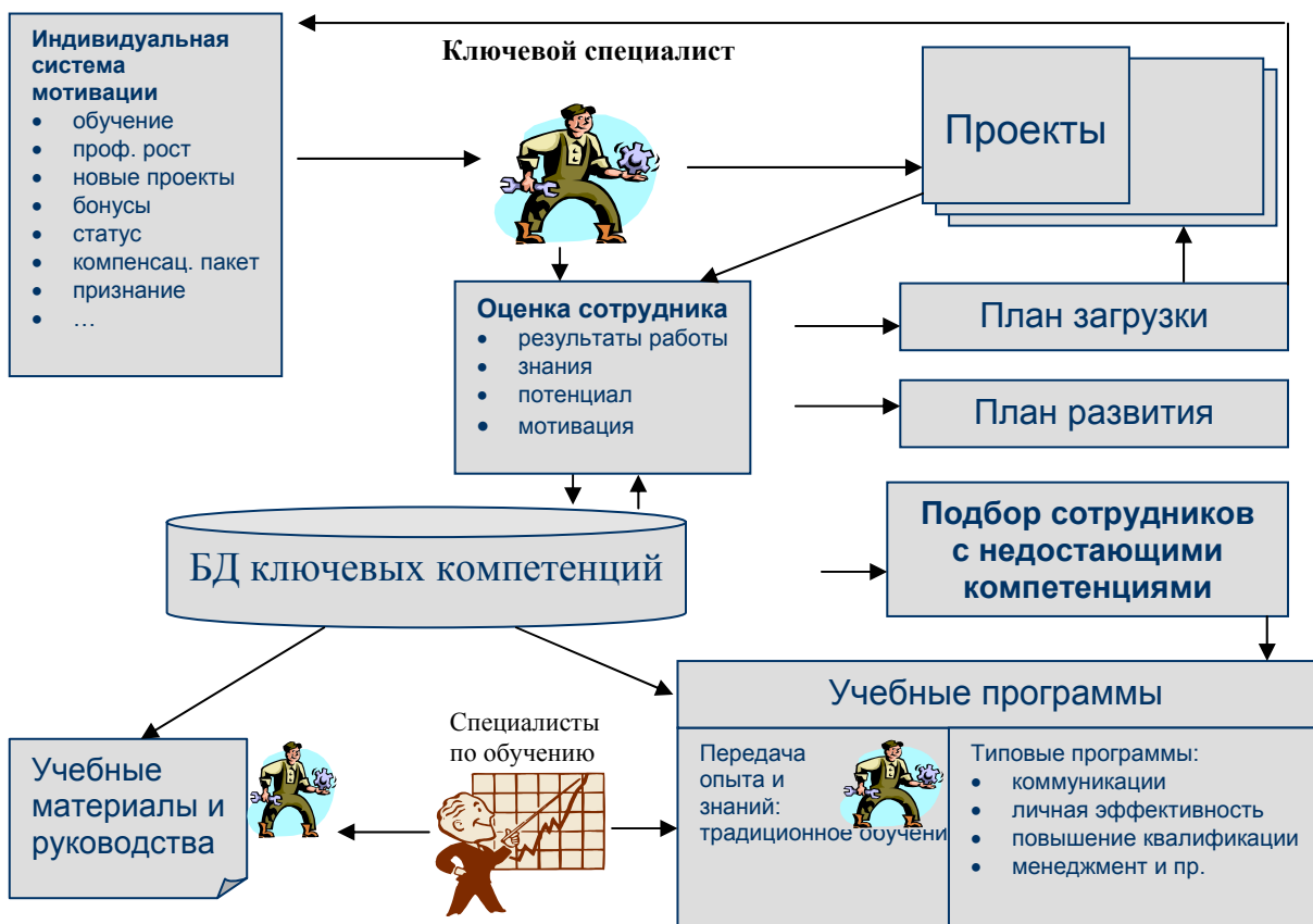
РИС. 2. СИСТЕМА УПРАВЛЕНИЯ КОМПЕТЕНЦИЯМИ.