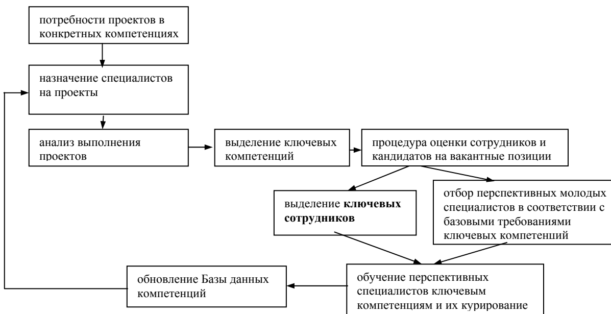
РИС. 3. ПОВТОРЯЮЩИЙСЯ ПРОЦЕСС РЕШЕНИЯ ЗАДАЧИ ПОВЫШЕНИЯ ДОСТУПНОСТИ КЛЮЧЕВЫХ КОМПЕТЕНЦИЙ В ПРОЕКТНО-ОРИЕНТИРОВАННОЙ КОМПАНИИ.

Разрешение этого противоречия, по убеждению авторов, лежит исключительно в особенностях построения системы мотивации в компании. Отметим наиболее важные моменты, которые необходимо учесть.